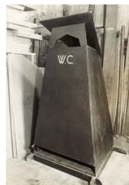
Caseta WC. AHG, 11. Sureda, 35/4-31

Per la documentació que conservem i que podeu resseguir a partir de la que contéu la calaixera de la ditada, sabem que aquestes construccions van anar molt més enllà de la Costa Brava, ja que el 1955 un representant comercial del Marroc en va demanar la representació per a Tetuan, Ceuta i Melilla, convençut del seu gran potencial en aquelles terres.