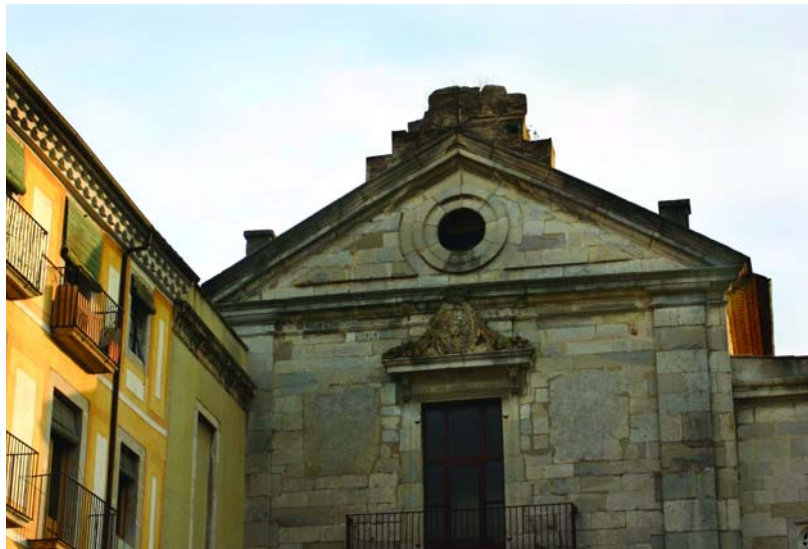
Façana de l'Arxiu.

Voldria que aquestes reflexions servissin per reivindicar el paper dels arxius i en aquest cas de l'Arxiu Històric de Girona, que és un servei per a totes les persones, sense diferències de si són historiadors, universitaris, documentalistes, allò que alguns en diuen lletraferits, o simples persones amb curiositat pel nostre patrimoni o per necessitats administratives. L'Arxiu és obert a tothom, fins i tot als esperits errants, testimonis d'èpoques passades.