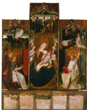
Retable de la Verge de Canapost, s.XV.

Amb el títol de Pintors i retaules dels segles XIV i XV a l'Empordà s'acaba de publicar un nou treball de Miquel Pujol i Canelles. El llibre ha estat editat per l'Institut d'Estudis Empordanesos i és el número 9 de la col·lecció de Monografies empordaneses. El treball de mossèn Pujol en aquesta ocasió se centra en el vessant pictòric de l'art gòtic empordanès, camp en el qual l'autor havia fet ja algunes aportacions importants, donades a conèixer en diversos articles .