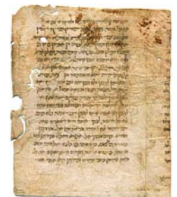
Fragment hebreu, AHG