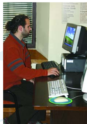
Sala de consulta.

– Nou maquinari L'Arxiu ha posat a disposició dels investigadors un segon PC de consulta a la sala. Un dels ordinadors restarà per a la consulta de les nostres bases de dades (catàlegs i inventaris de la major part dels fons dipositats a l'Arxiu). L'altre servirà de consulta per a qualsevol recurs en format digital: catàlegs d'altres arxius, material de les nostres exposicions, etc.